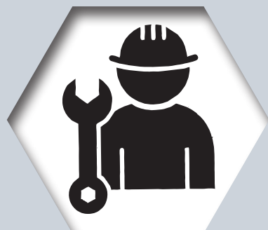
MAN | Service