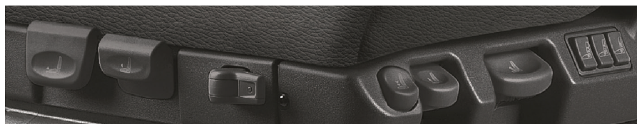
Obr. 1: Ovládací prvky na originálním sedadle řidiče MAN

Všechna originální sedadla řidiče MAN profitují z jednoduchého intuitivního ovládání různých individuálních možností nastavení. Řidič rychle rozpoznává funkce ovládacích prvků podle jejich tvaru a umístění. To pomáhá předcházet záměnám a velice to usnadňuje určení, v jakém směru je třeba ovládací prvky obsluhovat.